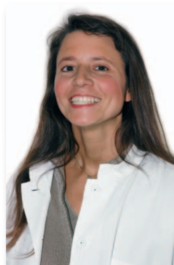
Autorin: Apothekerin Kathrin Müller

chronifizieren sich die Beschwerden. Die Gelenkentzündungen kehren wieder und/ oder neurologische Störungen bestehen dauerhaft. Da die Borreliose eine bakterielle Erkrankung ist, lässt sie sich prinzipiell gut antibiotisch behandeln. Frühzeitig eingenommen zeigt Doxycyclin eine zuverlässige Wirkung.